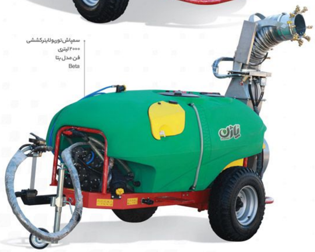
سمپاش توربولاینرکشی ۲۰۰۰ لیتری فن مدل بتا Beta