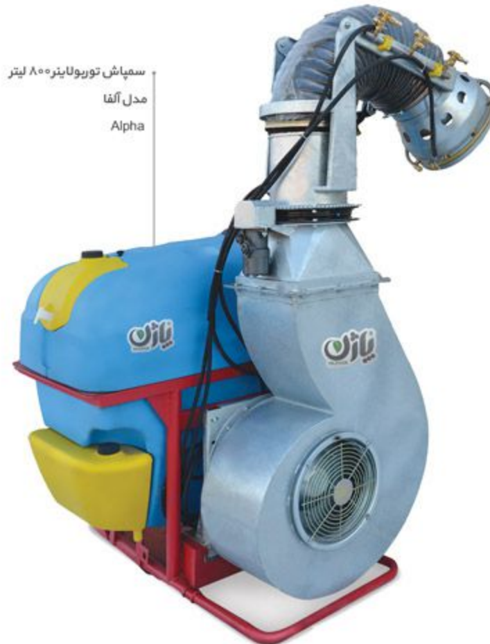
سمپاش توربولاینر ۸۰۰ لیتر مدل آلفا Alpha