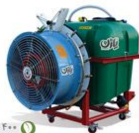
۴۰۰، ۶۰۰ و ۸۰۰ لیتری سوارشونده با فن اتومایزر باغی