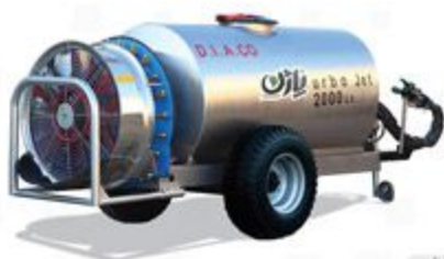
۱۰۰۰ و ۲۰۰۰ لیتری کششی اتومایزر باغی با مخزن استنلس استیل با فن امیکرون