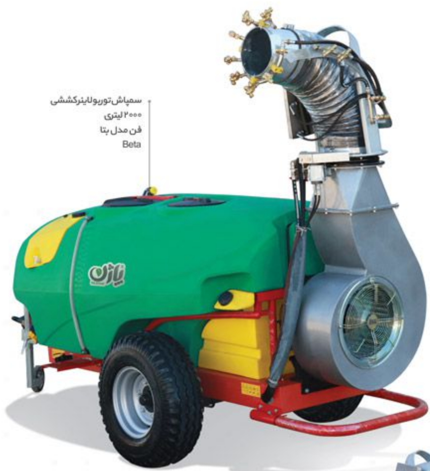
سمپاش توربولاینرکشی ۲۰۰۰ لیتری فن مدل بتا Beta