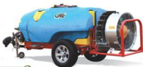
۱۰۰۰، ۱۵۰۰ و ۲۰۰۰ لیتری کششی اتومایزر باغی با فن آمگا