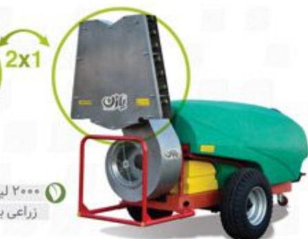
۲۰۰۰ لیتری کششی اتومایزر زراعی باغی دو منظوره