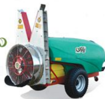
۲۰۰۰ لیتری کششی اتومایزر باغی با فن تآوری