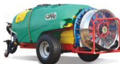
۲۰۰۰ لیتری کششی اتومایزر باغی با فن امیکرون