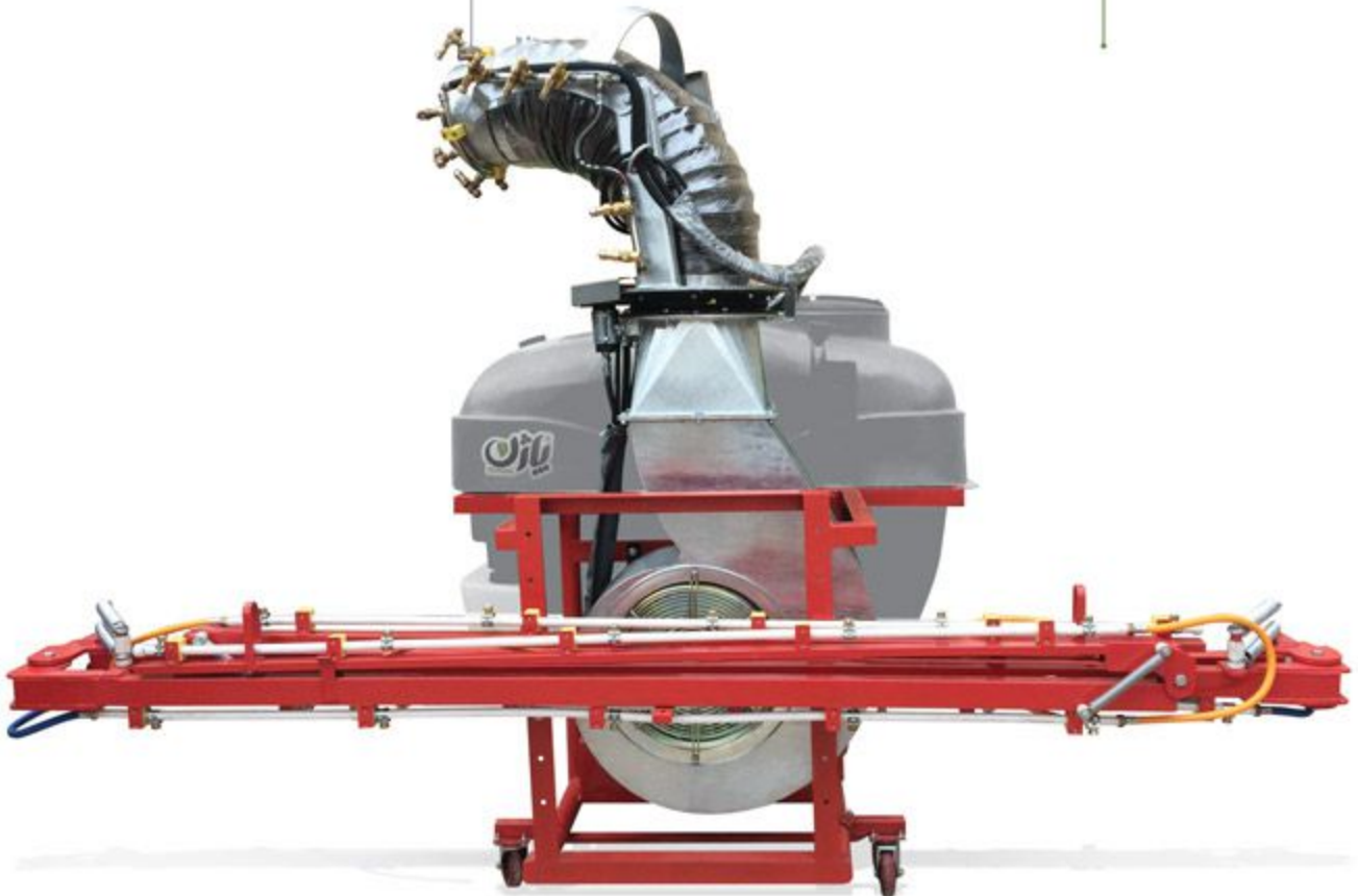
سمپاش ۸۰۰ لیتری توربولاینر مدل زتا Zeta