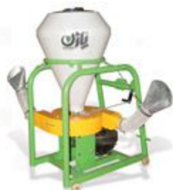
گوگرد پاش زراعی و باغی ۱۵۰، ۳۰۰ و ۵۰۰ کیلویی